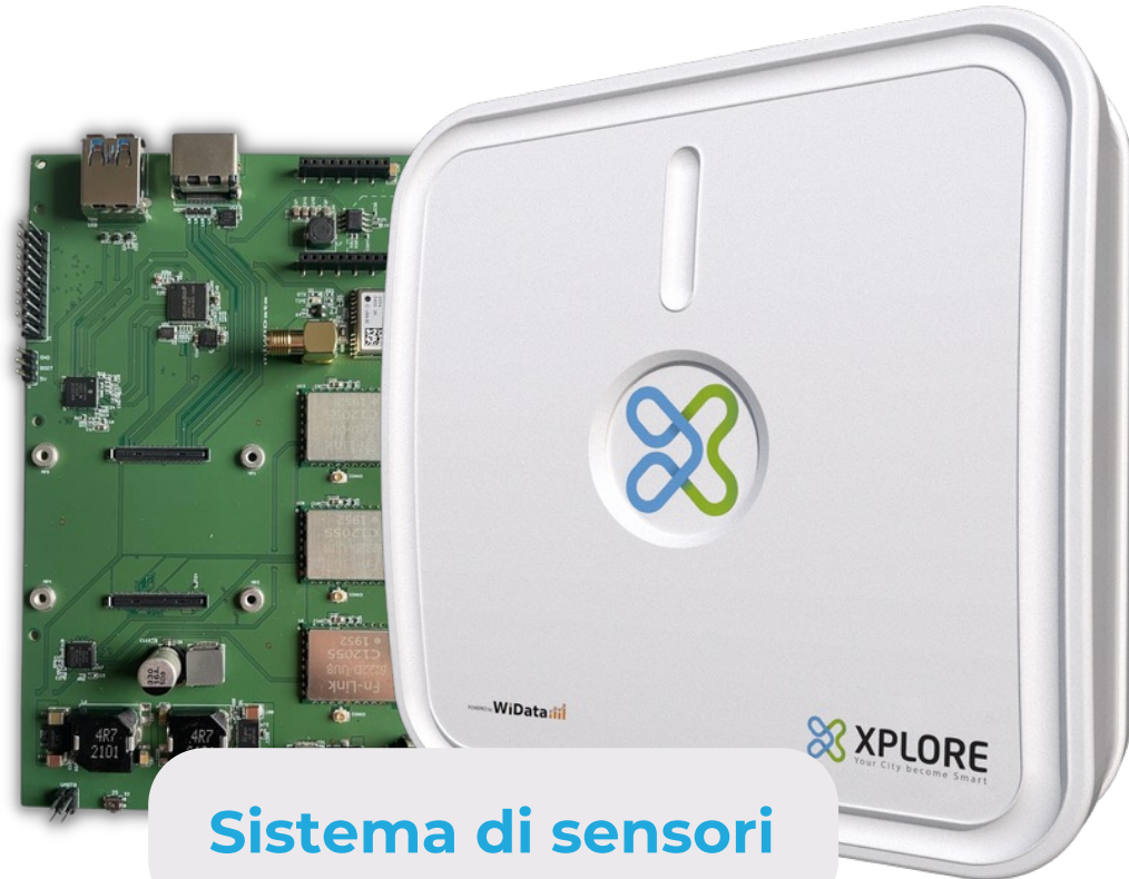
Sistema di sensori