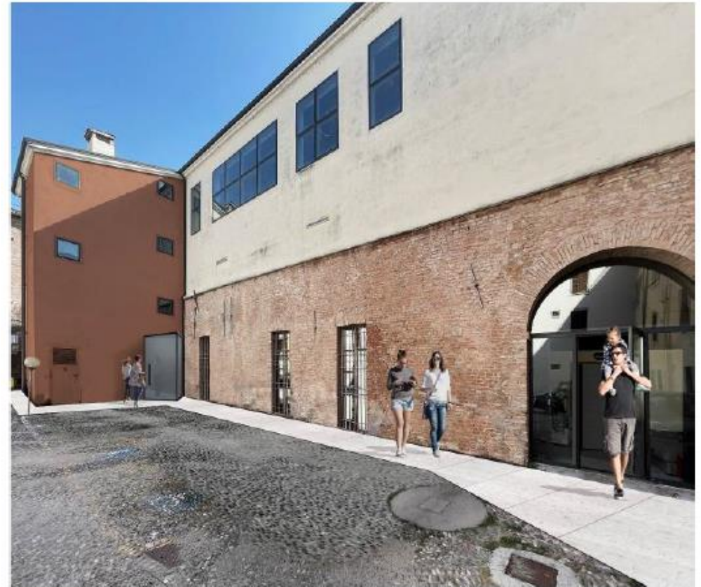
STATO DI PROGETTO: riapertura porte finestre esistenti e accesso palestra piano primo