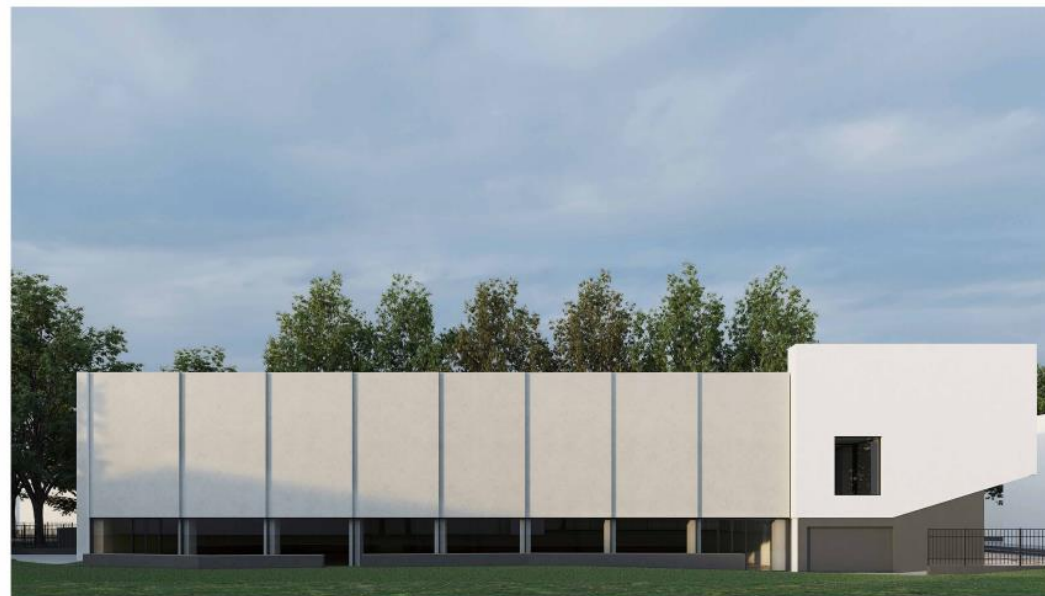
/ VISTA DAL CORTILE INTERNO DELLA SCUOLA - LATO EST