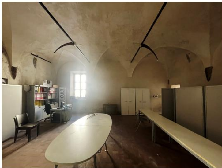
STATO DI FATTO UFFICIO: ex porte finestre