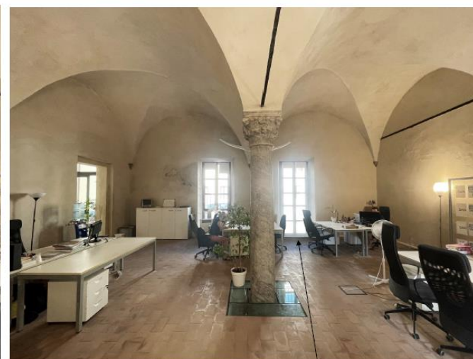
STATO DI PROGETTO UFFICIO: riapertura porte finestre