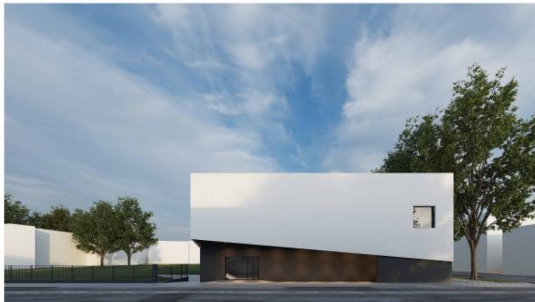
/ VISTA DA VIA ANDREA FERRARINI - LATO NORD