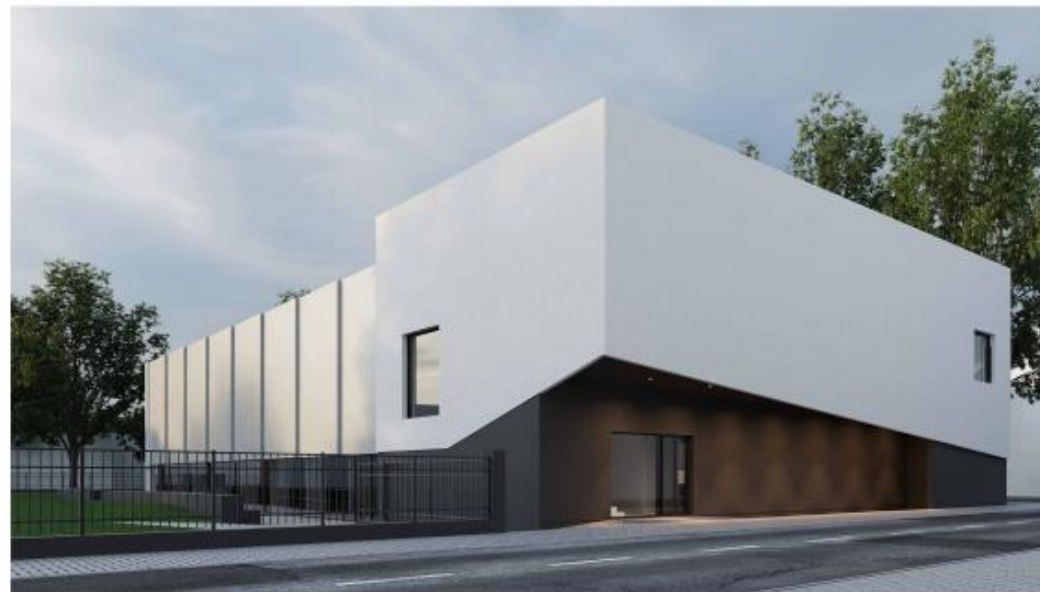
/ VISTA DA VIA ANDREA FERRARINI - LATO NORD EST