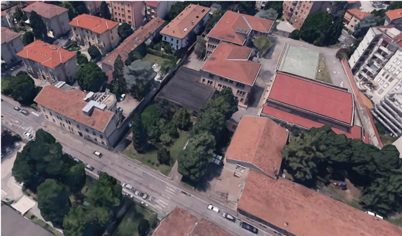
FOTO AEREA - STATO DI FATTO

L'intervento prevede la realizzazione di un nuovo volume nell'ambito delle aree esterne della scuola Bertazzolo.