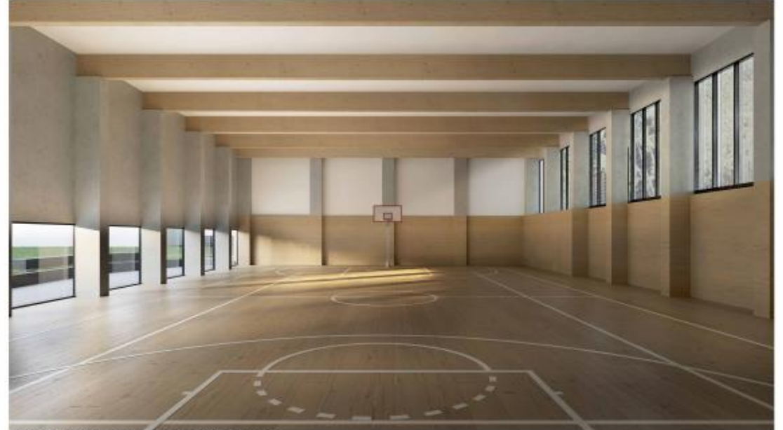
/ VISTA INTERNA DELLA PALESTRA - CAMPO DI GIOCO

L'intervento prevede la demolizione e la nuova costruzione di un fabbricato destinato a palestra e spazio polifunzionale nell'area di competenza della scuola Martiri di Belfiore, oltre ad alcuni interventi di riqualificazione del complesso esistente.