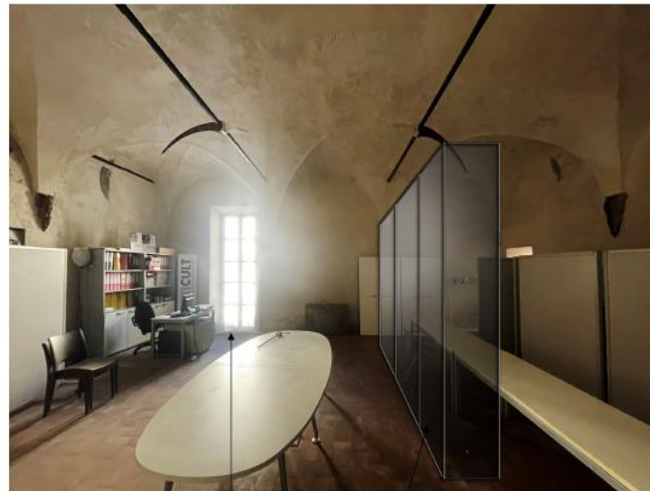
STATO DI PROGETTO UFFICIO: riapertura porte finestre +nuova divisoria vetrata dei locali per ragioni igienico sanitarie