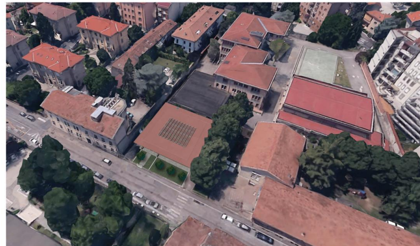
FOTO AEREA - STATO DI PROGETTO

La costruzione è divisa al proprio interno in tre parti: - nella porzione ovest la mensa a servizio della scuola e il locale di ricevimento pasti; - nella porzione est la sala polifunzionale - sala civica; - la porzione sud, adiacente al percorso carraio di servizio, è occupata da locali di servizio.