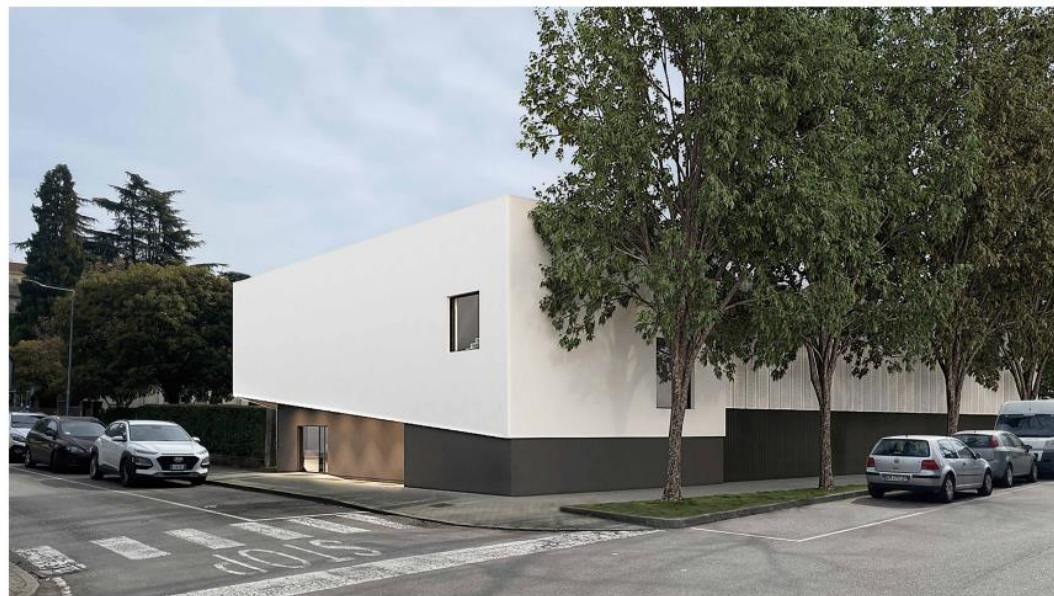
/ VISTA DA VIALE ANGELO PARILLA - LATO NORD OVEST