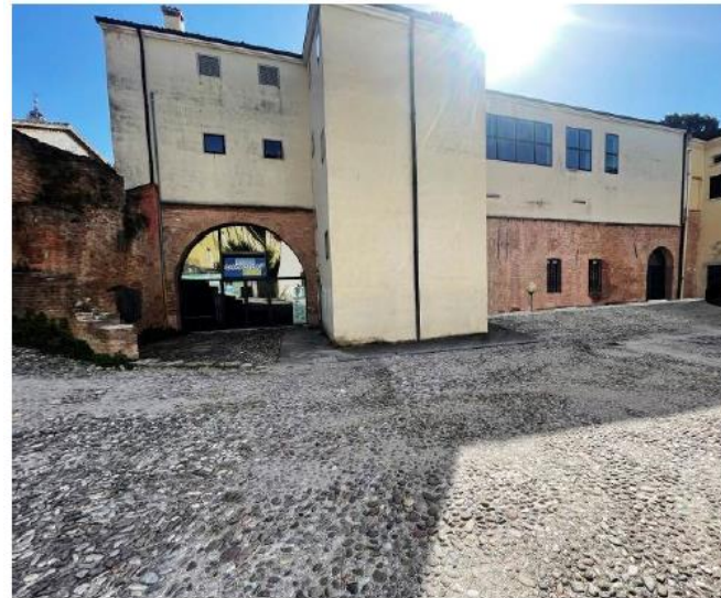
STATO DI FATTO: intervento solo al piano terra

L'intervento rappresenta una grande opportunità data la localizzazione centrale e l'ampio spazio del cortile esterno. Sant'Agnese10 ha le potenzialità per diventare punto di riferimento e di ritrovo per la collettività.