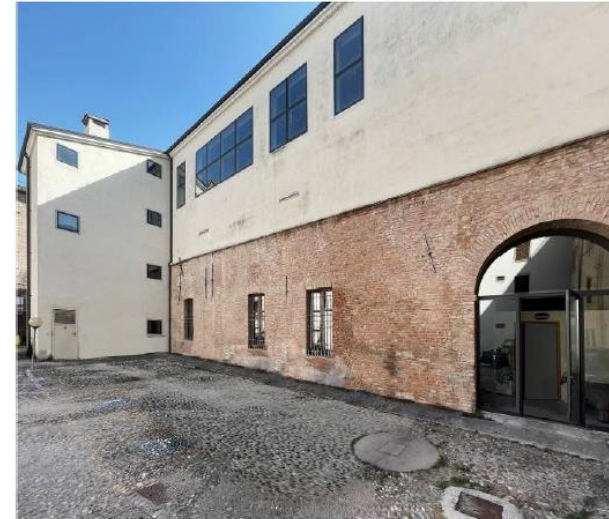
STATO DI FATTO: intervento solo al piano terra