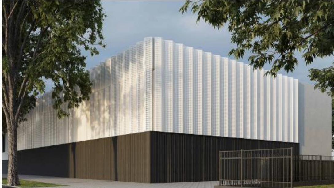
/ VISTA DA VIALE ANGELO PARILLA - LATO SUD